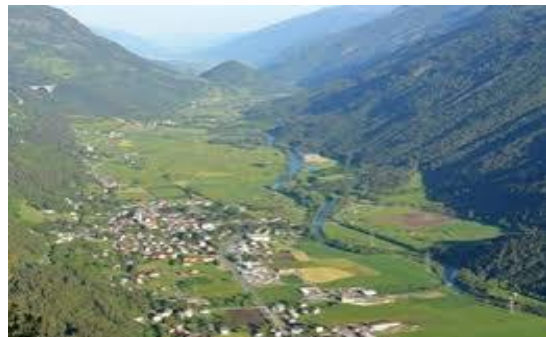
Himmelbauer Aussicht vom Himmelbauer